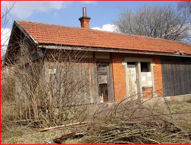
Das Nebengebäude finden wir 2011 in diesem Zustand vor.