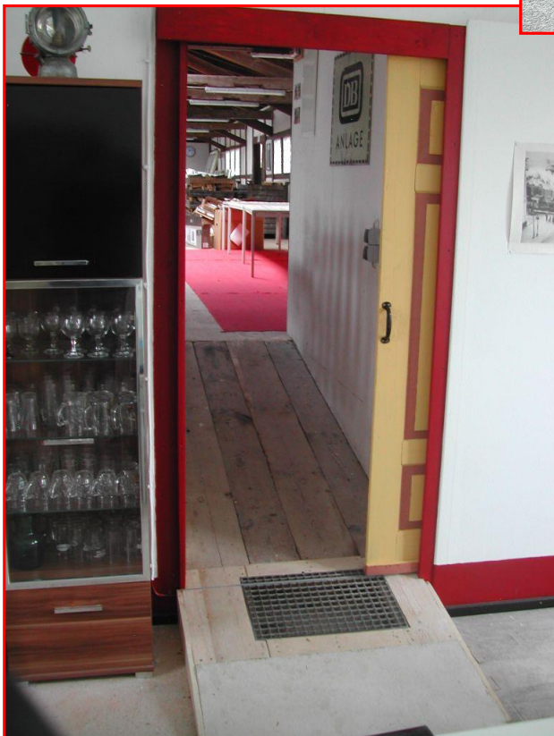
Der Innendurchgang wird ebenfalls neu geschaffen. Wie bei allen Baumaßnahmen legen wir Wert auf Barrierefreiheit und ermöglichen es somit, jede öffentliche Räumlichkeit ohne Treppenstufen zu erreichen.