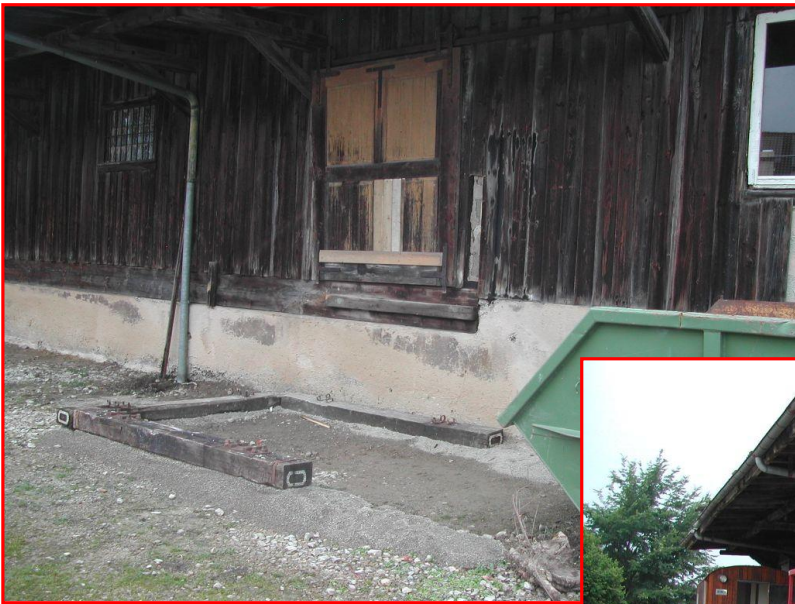
Der neue Haupteingang zum Güterschuppen entstand 2015.